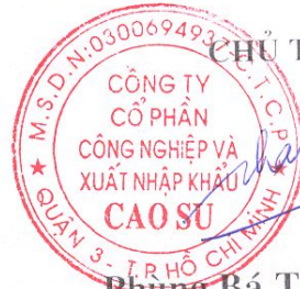
Phùng Bá Thành